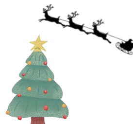
Adolf Barth Erster Bürgermeister