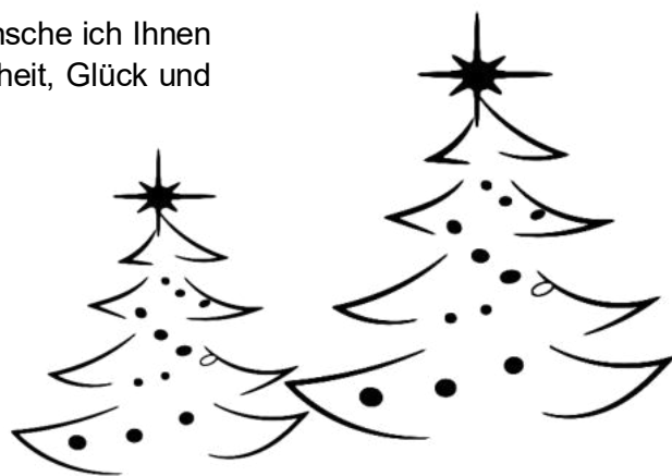
Adolf Barth Erster Bürgermeister